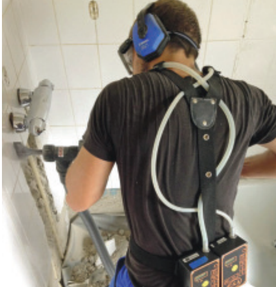
3 Abbruchhammer mit abgesaugtem Quermeißel im Einsatz.