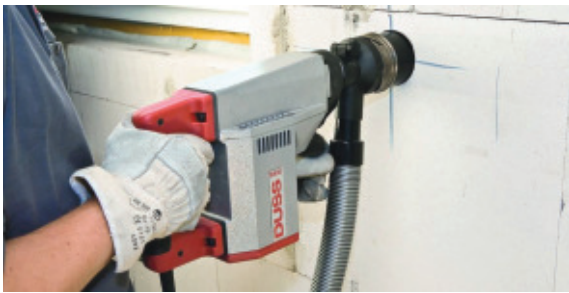
2 Abgesaugter Dosensenker von Duss, einer der Gewinner des Deutschen Gefahrstoffpreises 2016.