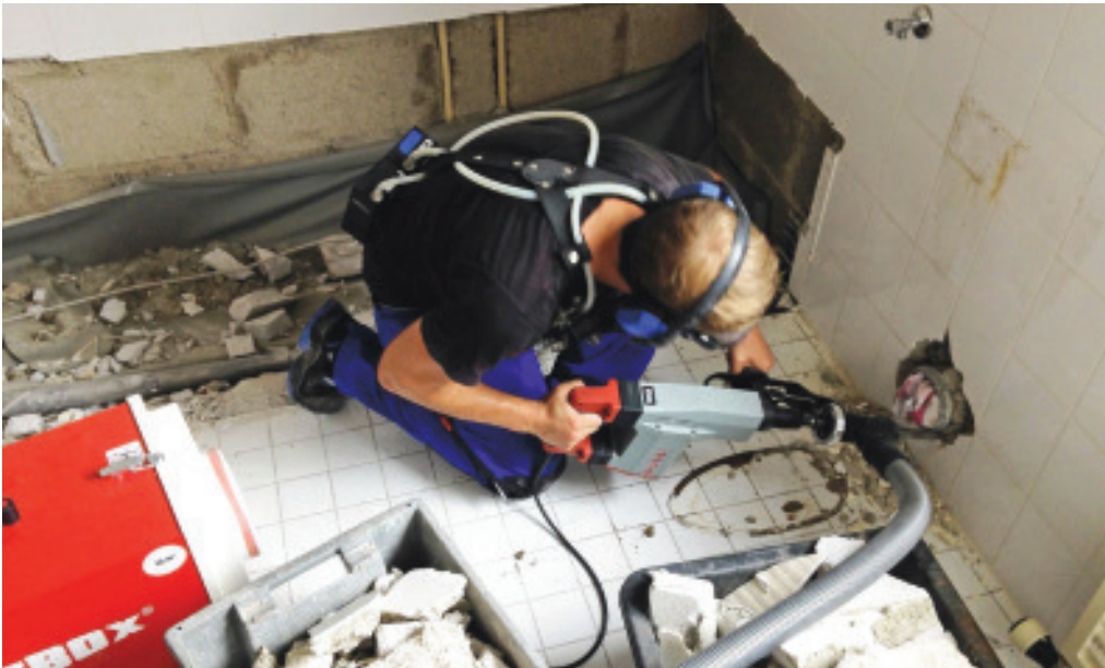
1 Abbruchhammer mit abgesaugtem Quermeißel im Einsatz, links ein Luftreiniger (Dustbox). Der Fliesenleger hat am Gürtel zwei Pumpen, die Luft in der Nähe des Gesichtes absaugen und auf einem Filter zur Analyse sammeln.